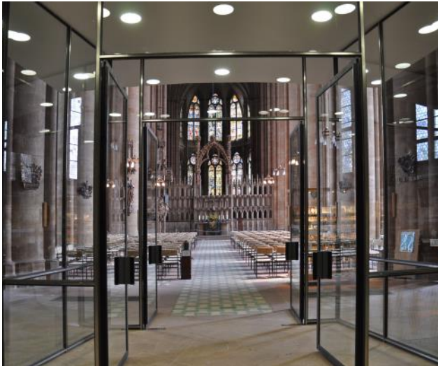
Fotos: Elisabethkirche in Marburg. Erbaut im 13. Jahrhundert, ist sie die früheste rein gotische Kirche Deutschlands. SÄLZER hat im Eingangsbereich einen Windfang in moderner Edelstahl-Sicherheitsglas-Konstruktion mit 3 m hohen Trennwänden mit mehreren Türein- und -ausgängen gebaut.