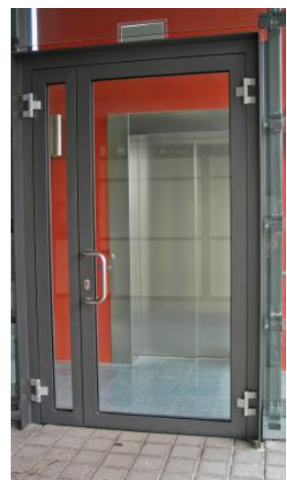
Fotos: Schutz gegen Feuer und Rauch, schickes Design und Transparenz durch einen hohen Glasanteil; für den Innen- und Außenbereich geeignet.