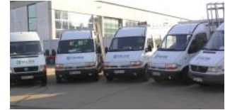
Heute hat SÄLZER mehr als 10 Montage- und Wartungsfahrzeuge sowie 2 LKW im Einsatz.