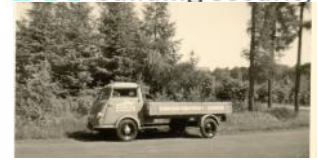
Der 1. SÄLZER LKW aus den 50er Jahren.

Auch bei diesen Sicherheitskonstruktionen ist der Besitzer gemäß der Richtlinie DIBt gesetzlich verpflichtet, die Anlage jährlich zu warten. SÄLZER empfiehlt auch die übrigen Brandschutztüren in Abhängigkeit von der Nutzungshäufigkeit warten zu lassen. Durch den professionellen Check, z.B. von Riegel und Falle, wird sichergestellt, dass die Tür im Ernstfall auch wirklich schließt.