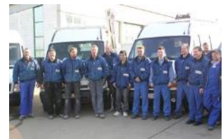
Das erfahrene Montage- und Wartungsteam.