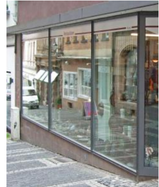
Schiebetüren, Fenster, Wintergärten, Fassaden oder Schaufenster.

Die Vorschriften für Schlagregendichtheit, Luftdurchlässigkeit, Widerstand gegen Windlast sowie Wärmedämmung werden selbstverständlich erfüllt.