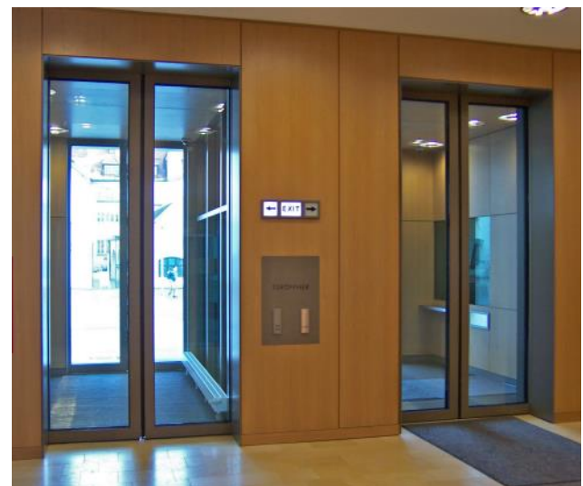
Foto: Aluminium-Schiebetüren, auch als Eingangsschleuse mit gegenseitig verriegelnden Türen erhältlich.