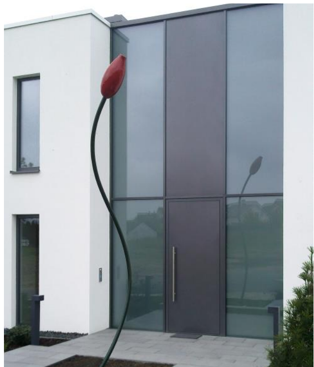
Foto: flächenbündige Tür, kombiniert mit einer eleganten Fassade in Glas und Aluminium, garantiert einen repräsentativen Eingangsbereich.

Die SÄLZER Produkte sind auch in Kombination mit Einbruchhemmung erhältlich.