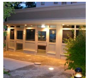
Wachhäuser & Pfortengebäude.