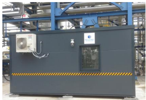
In der Standardausführung sind 3 Aluminiumfenster installiert.