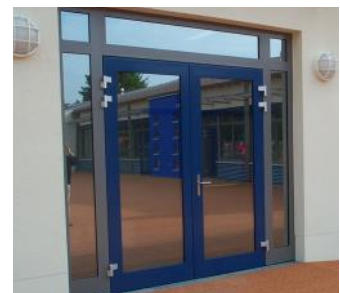
Türen & Tore in Stahl und Aluminium.

Fordern Sie unsere weiteren Produktkataloge über Fenster und Fassaden, Türen und Tore, Wachhäuser, Trennwände und Schleusen, Schranken, Barrieren, Poller und Zubehörkomponenten an.