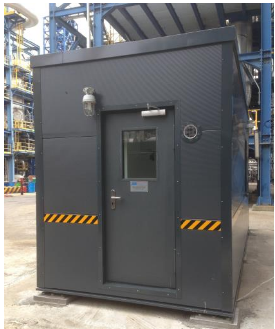
Verglaste Stahltür mit integriertem oberen Türschließer.