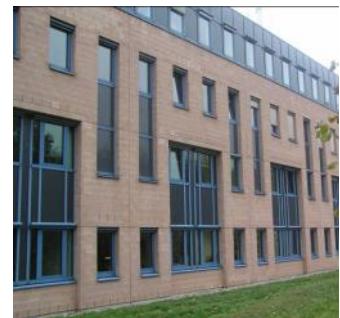
Fenster & Fassaden.

Spektakuläre Test Videos: youtube.com/user/saelzersecurity